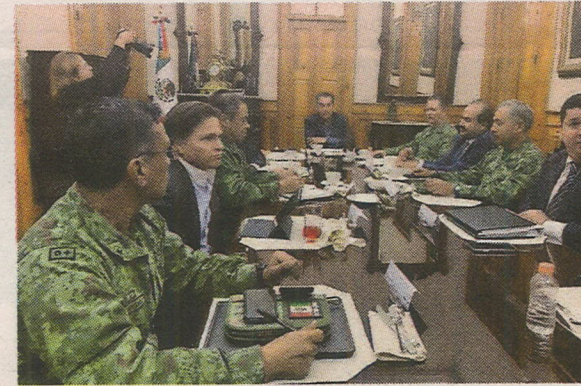
Reunión de mandos militares y Gobierno estatal.